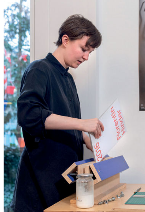
^ Neben Hightech ist manchmal auch Handwerk gefragt – wie hier beim Heften einer Broschüre.

Das ist auch nötig, wie die Grafikerin an einem Beispiel erklärt. «Wir haben ein Buch einer Künstlerin gestaltet, die vor allem mit Bleistift zeichnet. Damit die Werke im Buch gut zur Geltung kommen, haben wir nicht nur schwarz- weiss, sondern auch mit Silberfarbe gearbeitet. Das ist aufwändig und schwierig. Schon kleinste Abweichungen beim Druck könnten die Mühe zunichtemachen.»