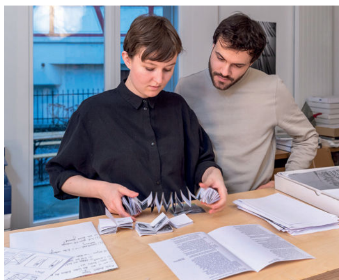
^ Der Austausch im Team ist ein zentraler Teil des kreativen Prozesses.